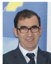
por: Licínio Nunes