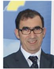
por: Licínio Nunes